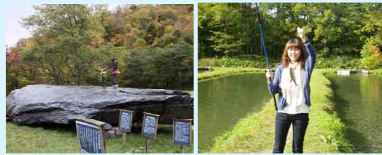
※写真は全てイメージです。

日高地域の資源である「ひだかのたから」を「ひだから」と言います。その「ひだから」の一つ、重さ約200tの巨石を見学。昼食は、北海道でも山奥の清流にしか生息できない山女魚をご自分で釣りあげてお召し上がり頂きます。