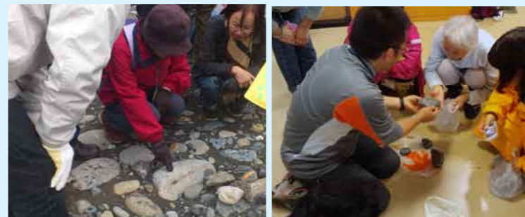
※写真は全てイメージです。

日高山脈の山麓にある日高町は、複雑な地質の上であり、さまざまな岩石が見られます。日高山脈ができる前、そのあたりは海の中でした。日本一の清流・沙流川で、実際に岩石や化石を観察して、美石を探してみましょう。そして太古の日高を感じてみませんか。