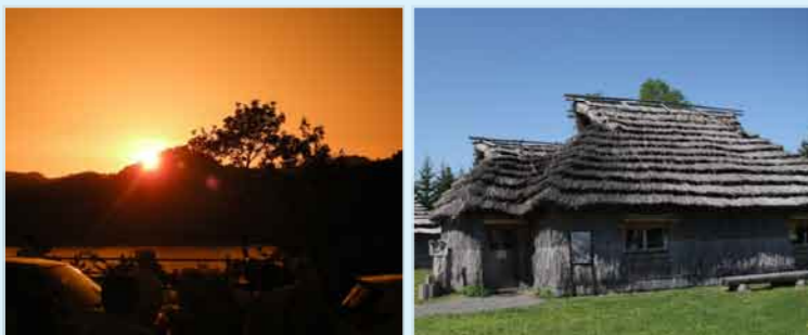
※写真は全てイメージです。

アイヌ文化の伝承地、オブシヌプリ(穴あき山)。夏至の日の前後3日間だけ、空いた穴に夕日が沈み幻想的な光景が見られます。夕日観賞後は、ポロチセ(伝統家屋)でユカラと語りべ(口承文芸)を観賞いたします。夕食はアイヌ伝統料理をお召し上がり頂きます。