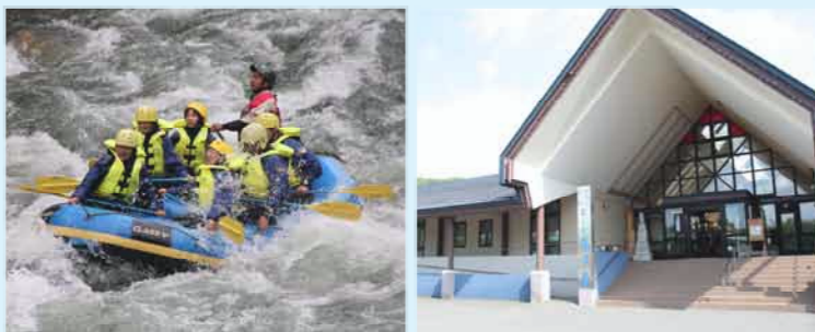
※写真は全てイメージです。